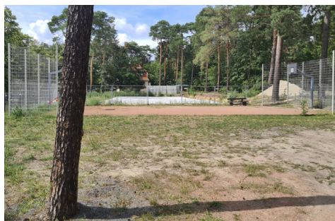
Die begonnene Baustelle des Hortgebäudes an der Oberschule