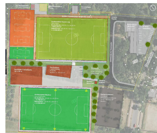
Auszug aus der Machbarkeitsstudie für den Sportplatz Groß Machnow (Planungsbüro Richter)