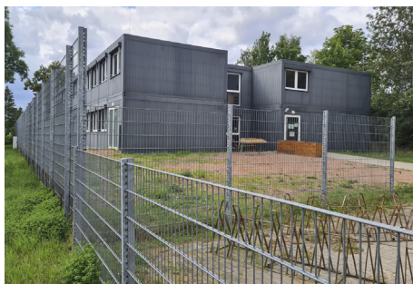
Die teure Containerburg am Fontaneweg