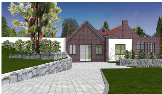
Das schon 2015 geplante Hortprojekt am Roten Haus

Da mit diesem Hin und Her noch kein einziger Hortplatz geschaffen wurde und die Zeit drängte, entsteht jetzt ein weiteres Hortgebäude weit entfernt von der Grundschule neben der Oberschule in der Großmachnower Straße – Kosten: 1,6 Millionen Euro. Die Kinder müssen ab Herbst täglich zwischen Schule und Hort pendeln. Wann die Oberschule umzieht und hier auch eine Grundschule besteht, hängt von den Ergebnissen einer laufenden Ausschreibung für einen neuen Oberschulstandort ab. Die SPD Rangsdorf hatte damals vorgeschlagen, einen komplett neuen Grundschulstandort zusammen mit der Oberschule, der geplanten großen Sporthalle und den Sportanlagen im Bückergelände anzusiedeln – dort kann auch das zukünftige Schülerwachstum bewältigt werden, beide Schulen ergänzen sich ideal. Das jetzige Oberschulgebäude hätte für eine Kita, als Vereins- und Kulturhaus und für die Musikschule genutzt werden können. Leider gab es dafür keine Mehrheit. Jetzt muss auf der begrenzten Fläche dort nicht nur der Hort entstehen (der in einigen Jahren wieder zu klein sein wird), sondern für 3,8 Mio. € auch noch eine kleine Sporthalle mit einer erweiterten Schulspeisung.